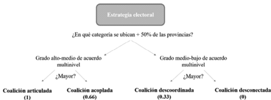
GRÁFICO 1 Criterios de clasificación para los casos